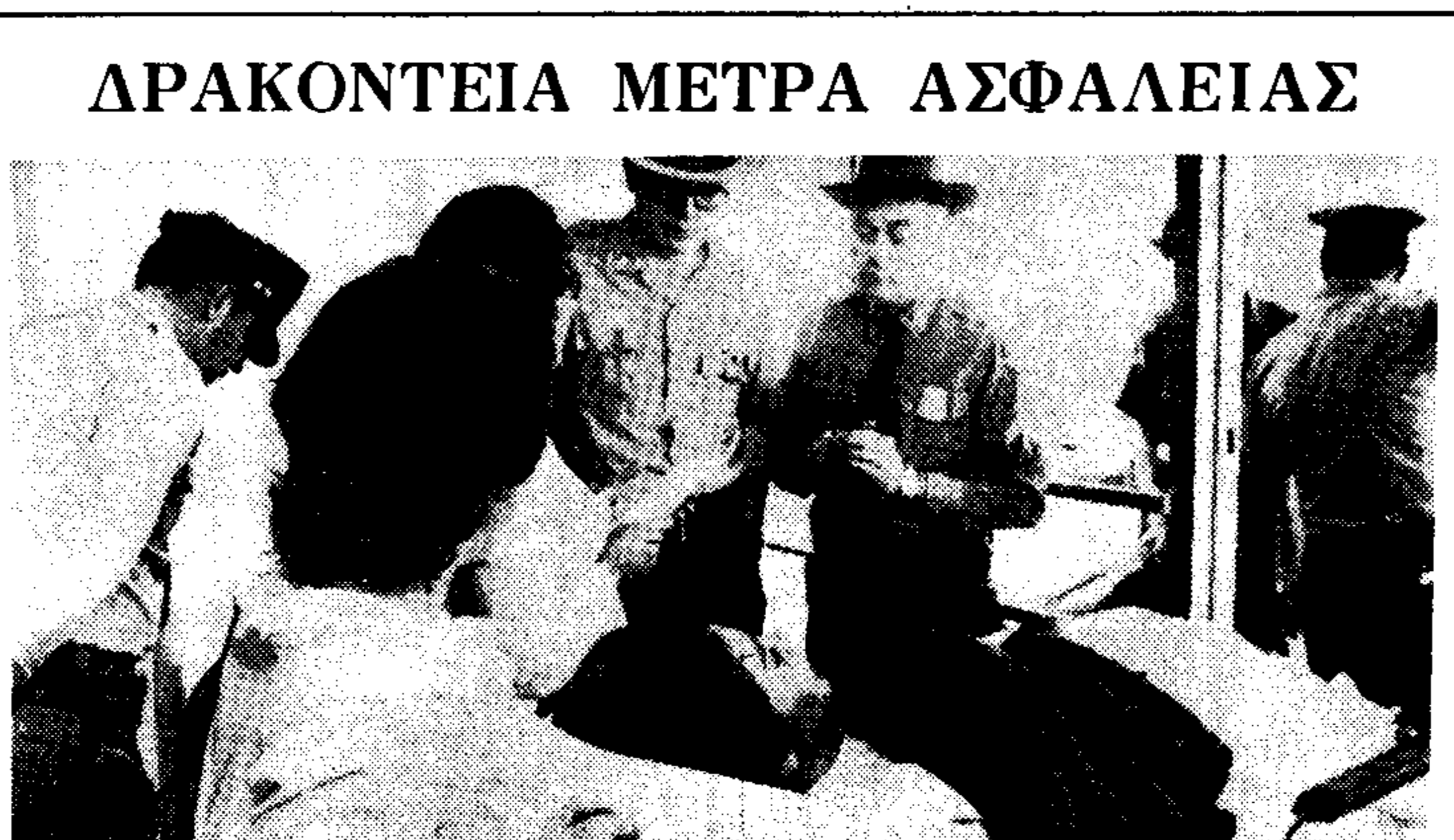
Δρακοντεία μετρα ασφάλειας έχουν ληφθεί στο ναοκαίο του Σίλβερ Σπρίνγκ όπου νοσηλεύεται ο κυβερνήτης της Αλαμπάμα, Τζόρτζι Ουάλας, θύμα της δολοφονικής άσπαστρας.

τασης του δολοφόνου και έκτινων που τον έκτινων, διότι γενικά πιστεύεται ότι δεν έβρασε σαν μεμονωμένο άτομο. Οι έκτίσεις συγκλίνουν προς τις μουσικές τρομοκρατικές άμάδες, αν και δεν άποκλείονται